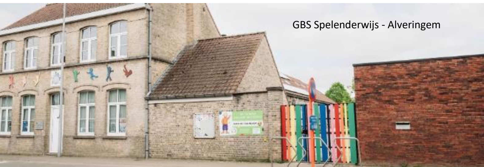
GBS Spelenderwijs - Alveringem

Met vragen kan je ook steeds terecht bij de directeur of de administratieve medewerker.