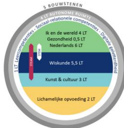
Onderwijstijd Leer Lokaal Fase 3 (Vlaanderen)