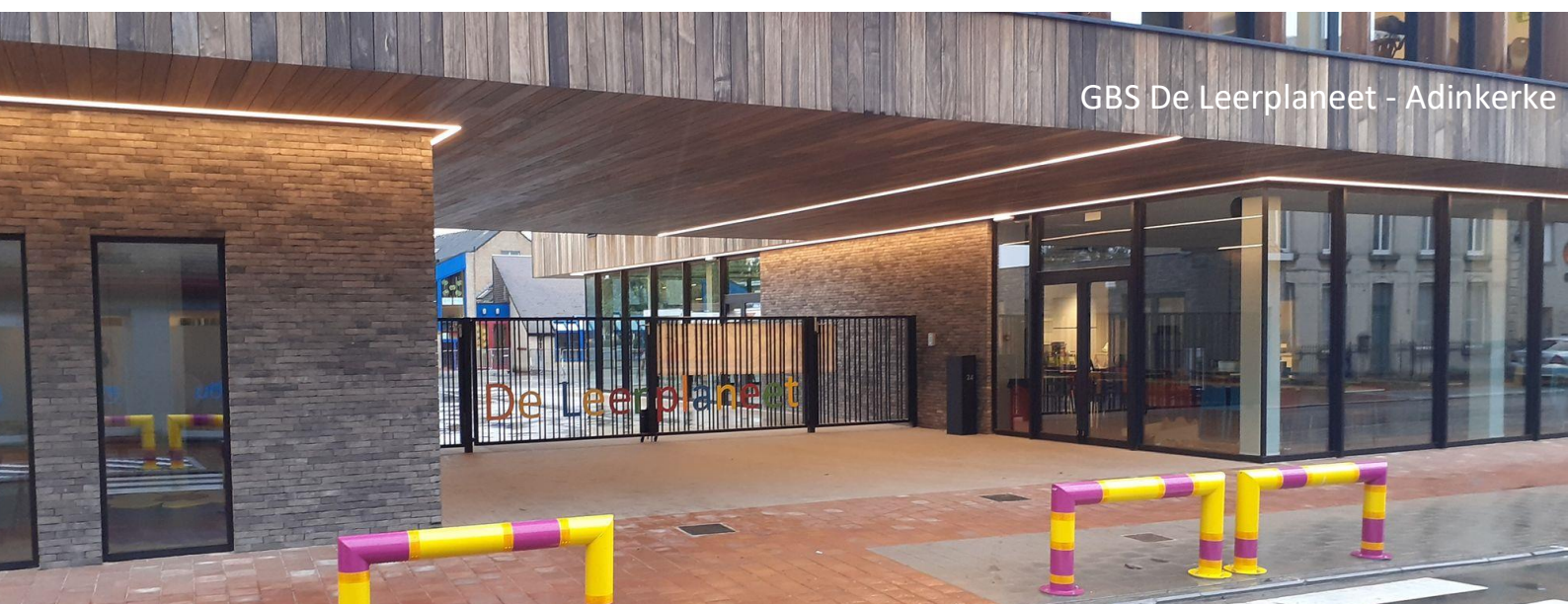
GBS De Leerplaneet - Adinkerke