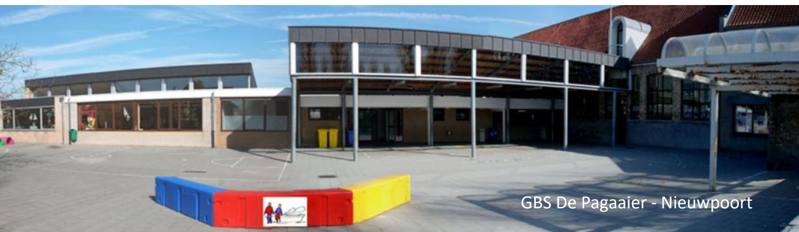
GBS De Pagaaiër - Nieuwpoort