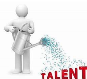
Gbs De Horizon - Snaaskerke

De pedagogisch begeleider is gehouden aan een deontologische code. De begeleider zal op vraag tot op de klasvloer helpend ondersteunen. De begeleider ondersteunt, maar neemt niet deel aan het evaluatieproces.